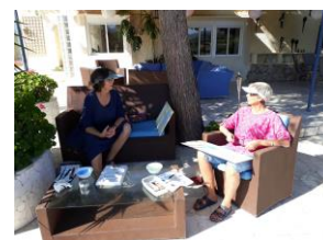
fra kurset i 2018